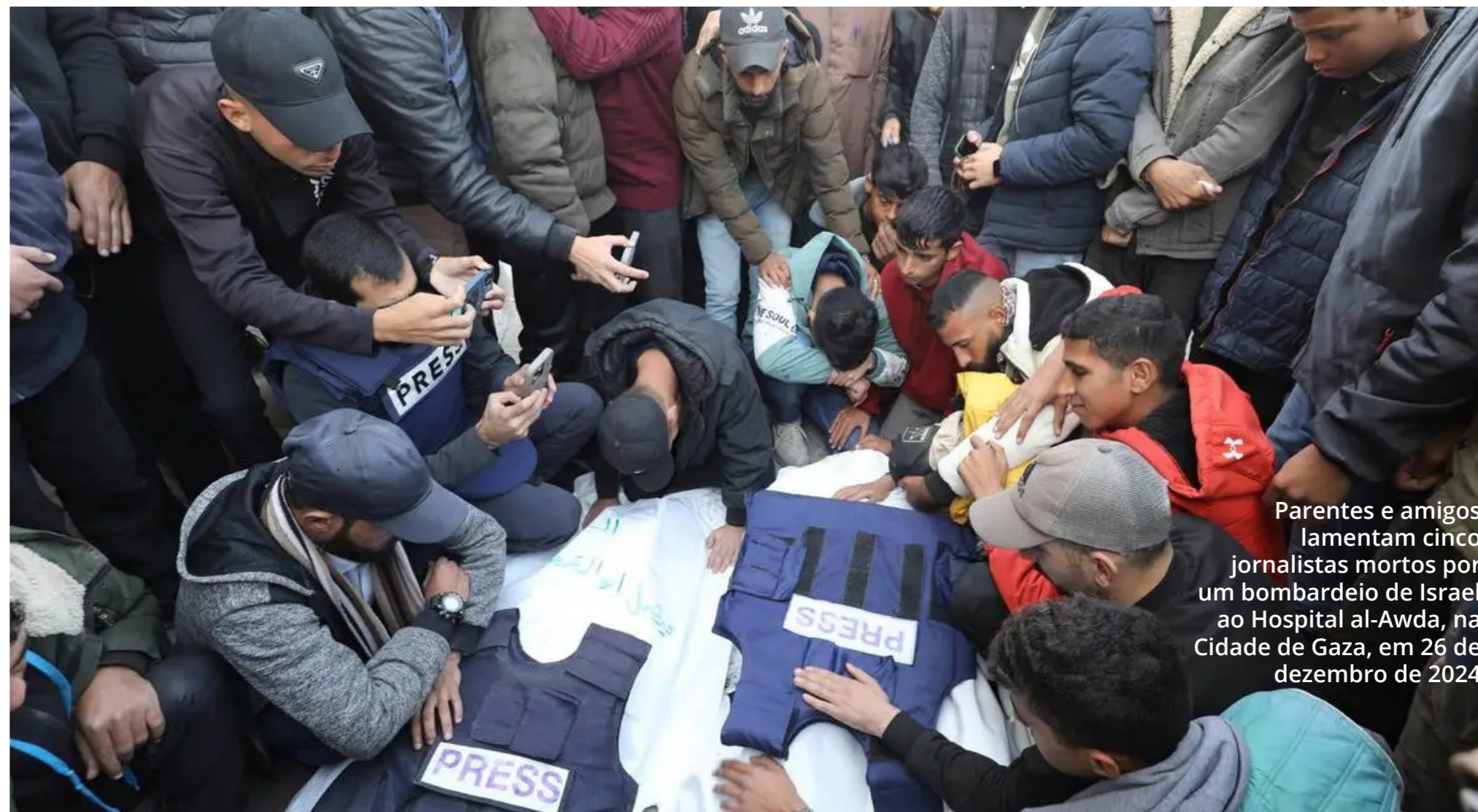
Parentes e amigos lamentam cinco jornalistas mortos por um bombardeio de Israel ao Hospital al-Awda, na Cidade de Gaza, em 26 de dezembro de 2024

No Brasil, a Fenaj vem realizando diferentes atividades e ações e, entre elas, comentamos: notas de repúdio, campanhas em suas redes e nas de sindicatos filiados denunciando a morte dos colegas, pedindo medidas urgentes de proteção, enviando ofícios às autoridades nacionais e internacionais