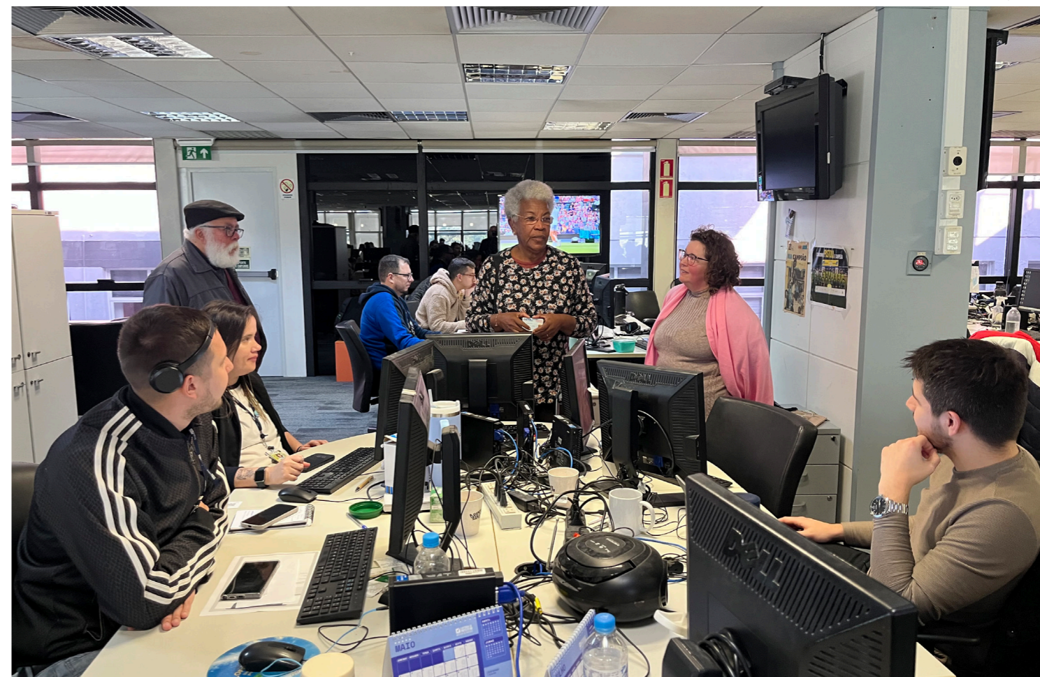
SindJoRS visitou as redações em Porto Alegre ressaltando a importância da negociação coletiva

Na segunda reunião, a patronal surpreendeu ao oferecer apenas 80% do INPC, parcelado em duas vezes, quebrando o acordo de discutir