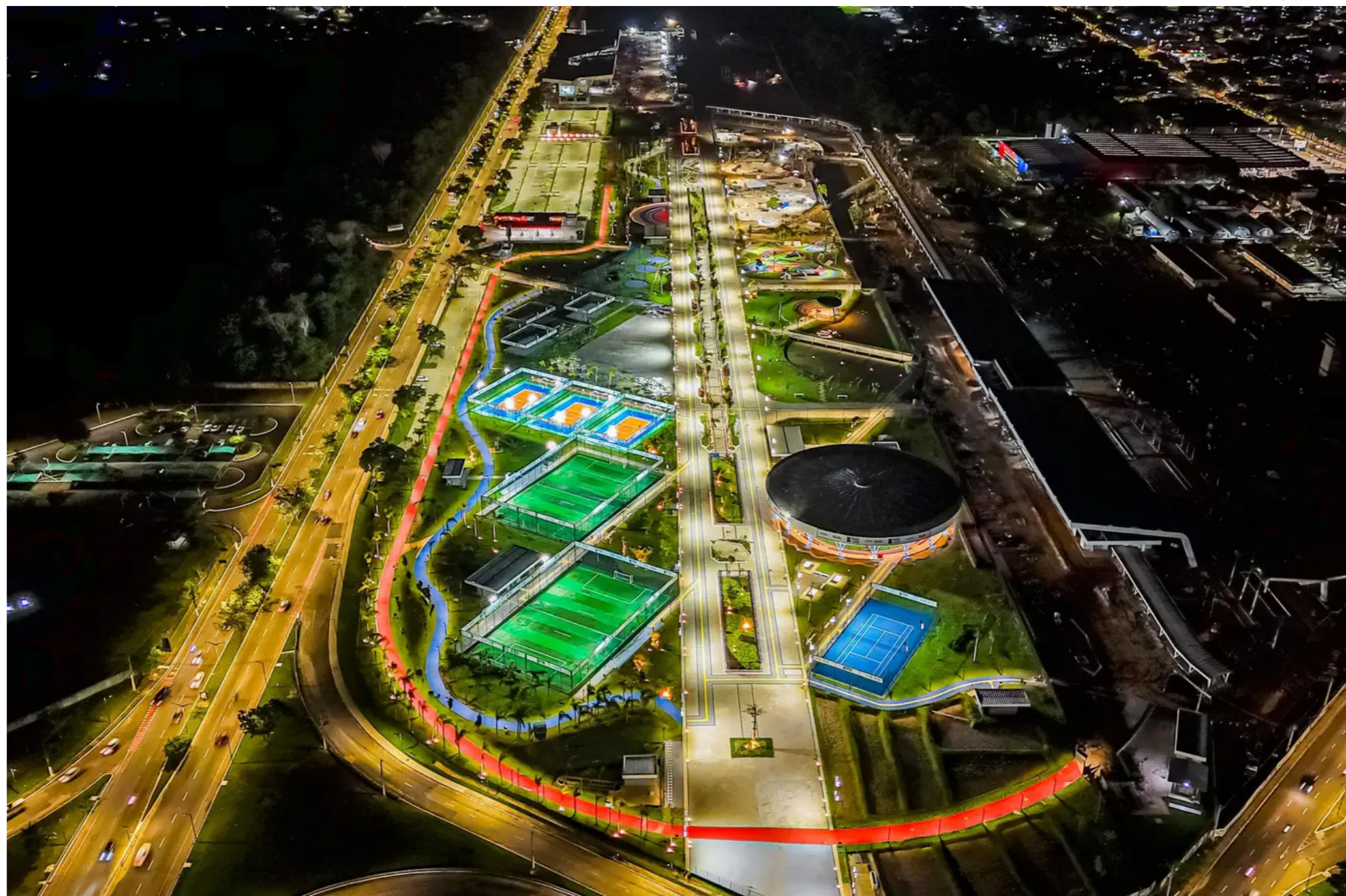
Parque da Cidade tem uma área de 500 mil metros quadrados e será a sede da COP30

A cobertura exigirá do jornalista, portanto, muito planejamento. Principalmente porque eventos simultâneos sobre o tema ambiental também ocorrerão em Belém, mas fora da área do Parque da Cidade. São as chamadas COPs Paralelas. Entre os movimentos popula-