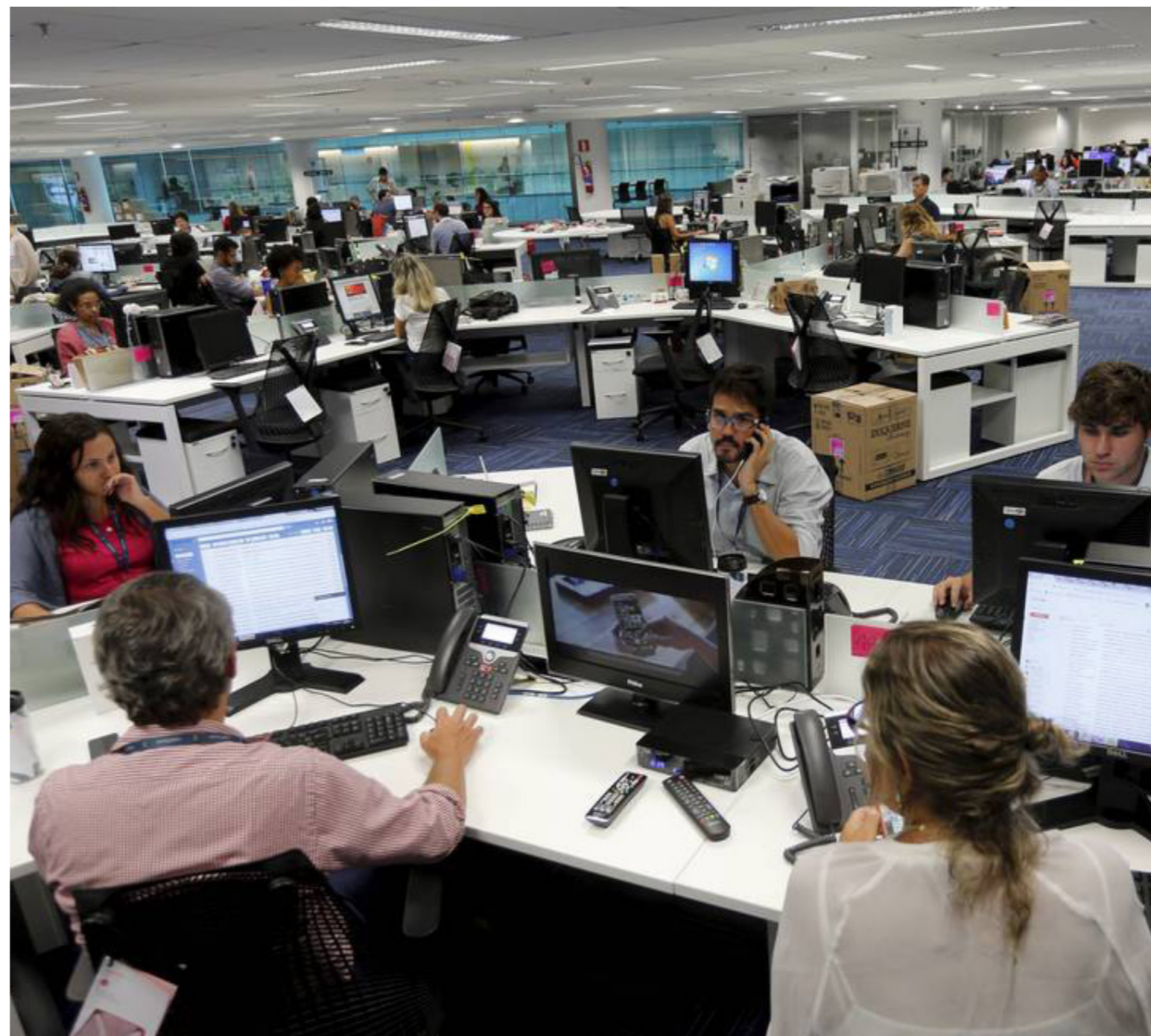
As redações são uma fábrica de produção de informações e notícias

Temos a matéria prima, nesse caso a sucessão de eventos contínuos e confusos que é a vida cotidiana. Um trabalhador que faz um recorte nos eventos de maior destaque, que passam por uma verdadeira linha de montagem para transformar aquele momento em algo informativo e atrativo (seja em áudio, texto ou vídeo), assim chegamos ao produto final, a notícia. Esta vai